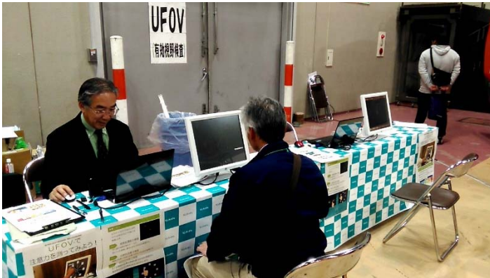
農機展示会場の一角にUFOV検査会場を設置